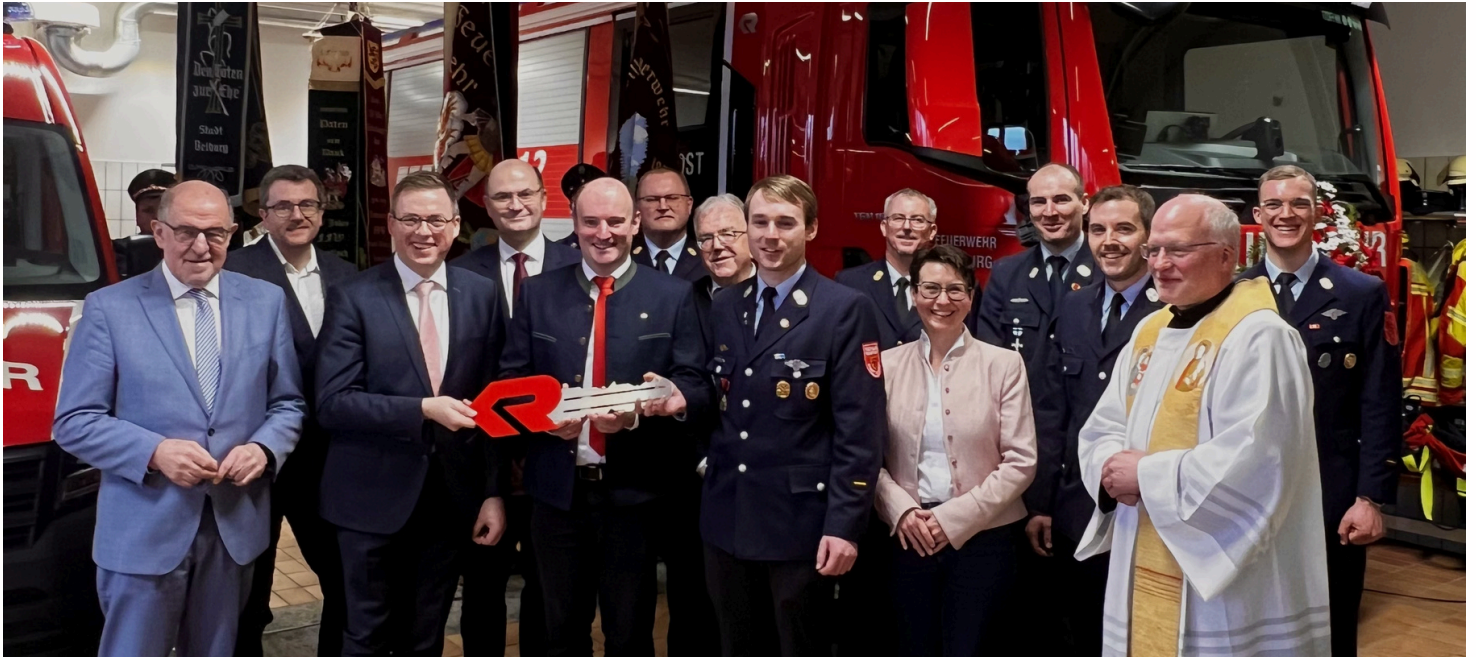
Fahrzeugweihe Februar 2026